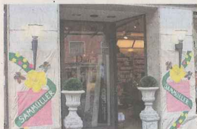
Noch im Rennen: Eine Chance auf den Pokal hat die Parfümerie Sammüller.