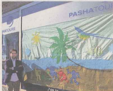
Derzeit auf dem 2. Platz: Pasha-Tours und die Pankrätiussschule.

Für die Sieger hat die Aktionsgemeinschaft Lechhausen 150 Euro ausgelobt. Gezählt werden nur die persönlich in den Geschäften abgegebenen Stimmen.